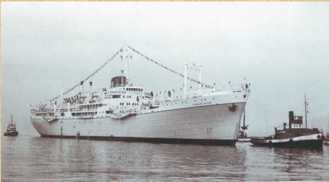
El Ciudad de Toledo durante su viaje como Exposición Flotante Española.

África, Patrona de Ceuta. Después, tras visitar San Sebastián, zarpó con rumbo a Lisboa. Desde entonces y, hasta que rindió viaje en Barcelona, el 22 de Diciembre, visitó treinta y tres puertos de Portugal, Marruecos, Brasil, Uruguay, Argentina, Venezuela, Colombia, Panamá, Costa Rica, México, Estados Unidos, Cuba, Haití, República Dominicana, y Puerto Rico, además de las ciudades españolas Bilbao, Pasajes, La Rábida (Huelva), Las Palmas de Gran Canaria, Santa Cruz de Tenerife, Ceuta, Melilla, Valencia y Barcelona.