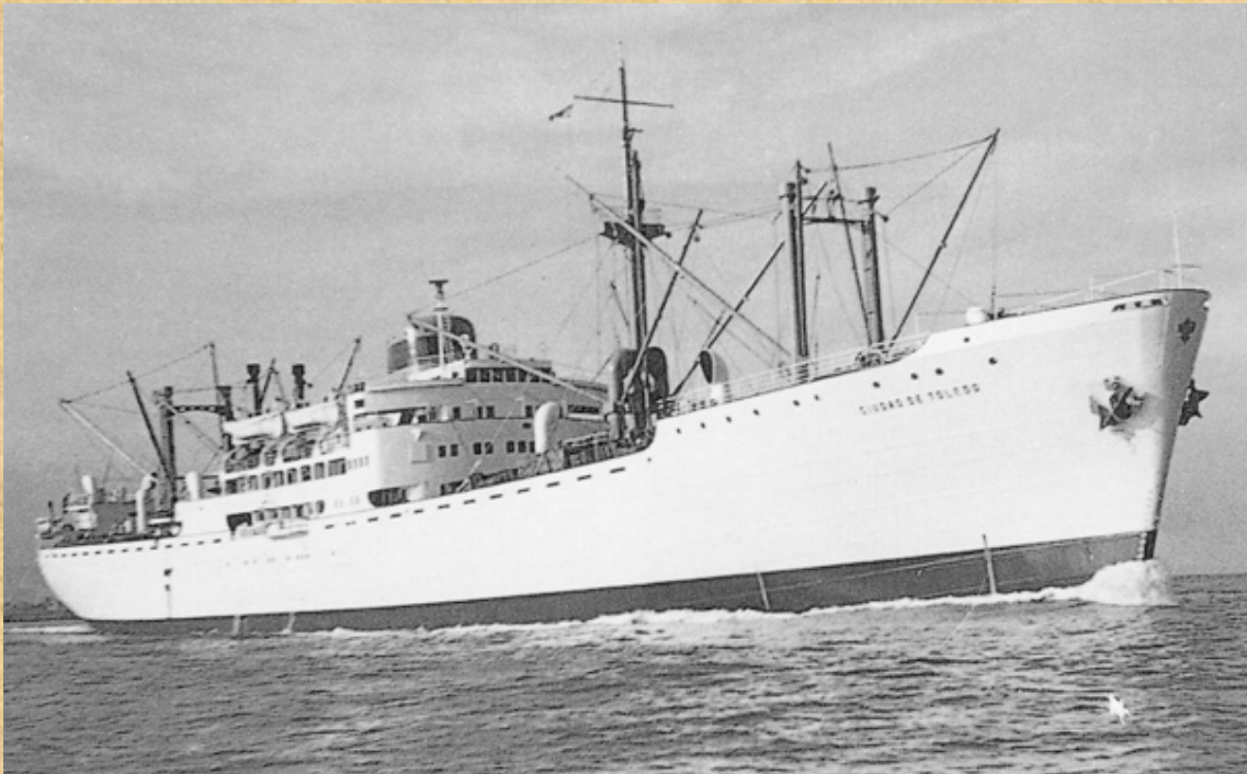
El Ciudad de Toledo con los colores de la contraseña de la Compañía Trasmediterránea.

España, que, por su mayor proximidad al centro de la ciudad, resultaba más apropiado para la visita del público, que comenzó inmediatamente. A lo largo de las siguientes treinta horas pasaron por la Exposición más de setenta y dos mil personas, en su gran mayoría, de Tetuán, Ceuta e, incluso, algunas venidas del otro lado del Estrecho.