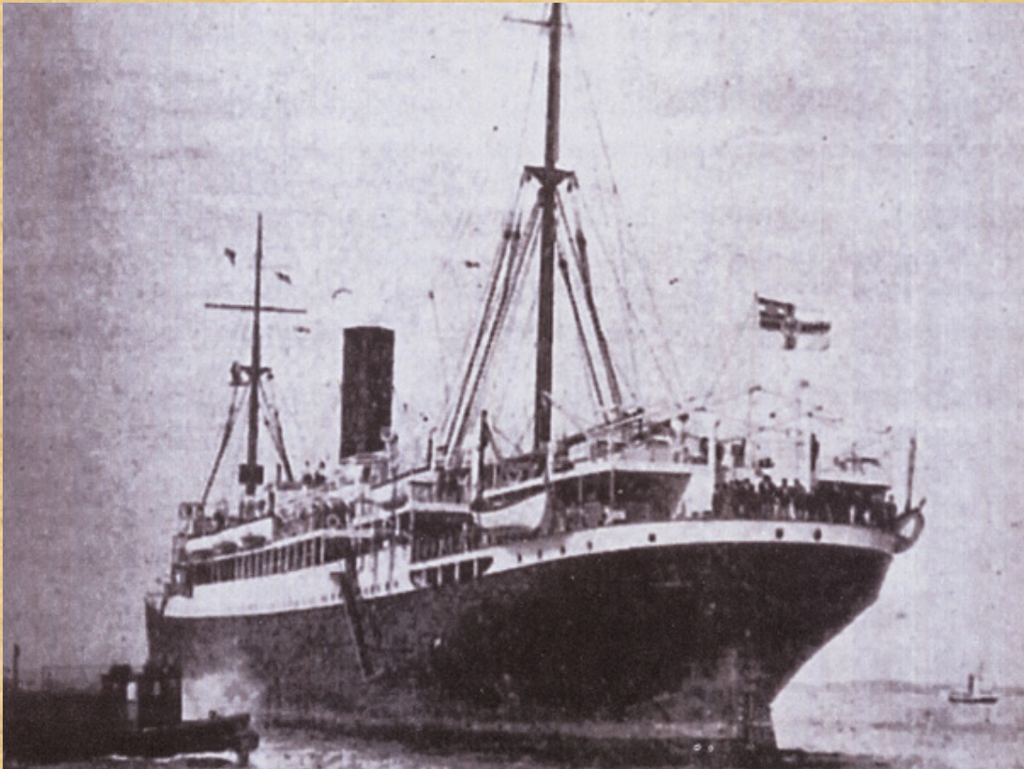
Buque Appam , que prestó auxilio al buque español Teide .

faenas de a bordo, y que estaba previsto desembarcaran en el mismo puerto en el viaje de regreso. En San Carlos son 400 los pasajeros nativos que suben a bordo con destino a Bata, y es durante esta travesía cuando el Teide embarranca en punta Oscura, al SO de la isla de Fernando Poo, en un lugar llamado por los nativos Etepo, junto al río Baña y muy próximo a punta Sagre y que hemos señalado en el mapa que adjuntamos; eran las tres de la madrugada del 8 de junio.