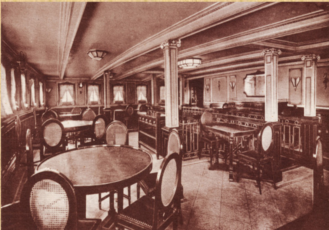
Comedor de 1 a Clase del buque Teide.