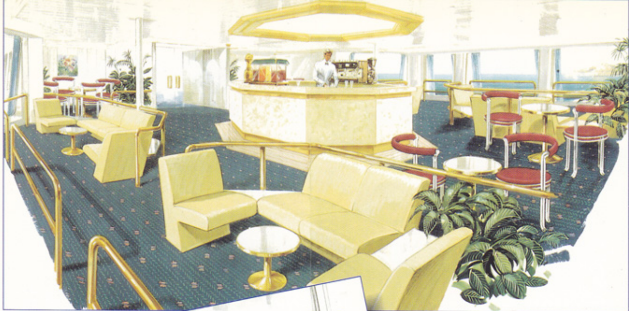
BAR - CLASE CLUB