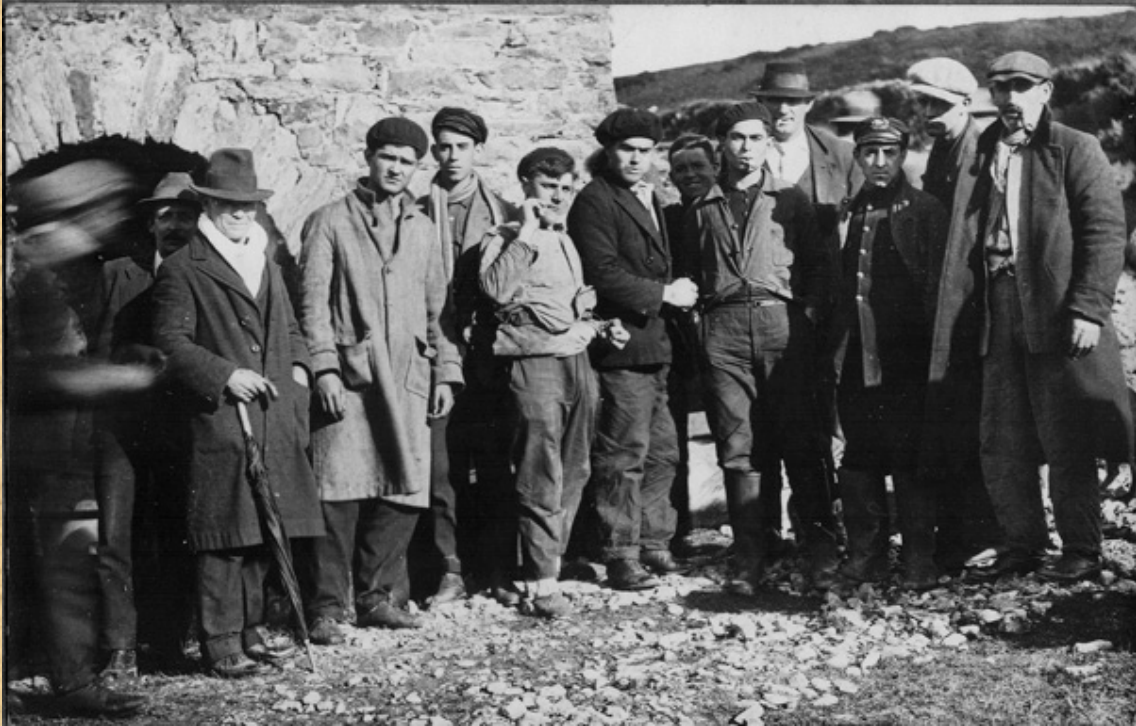
Parte de la tripulación después de su rescate.