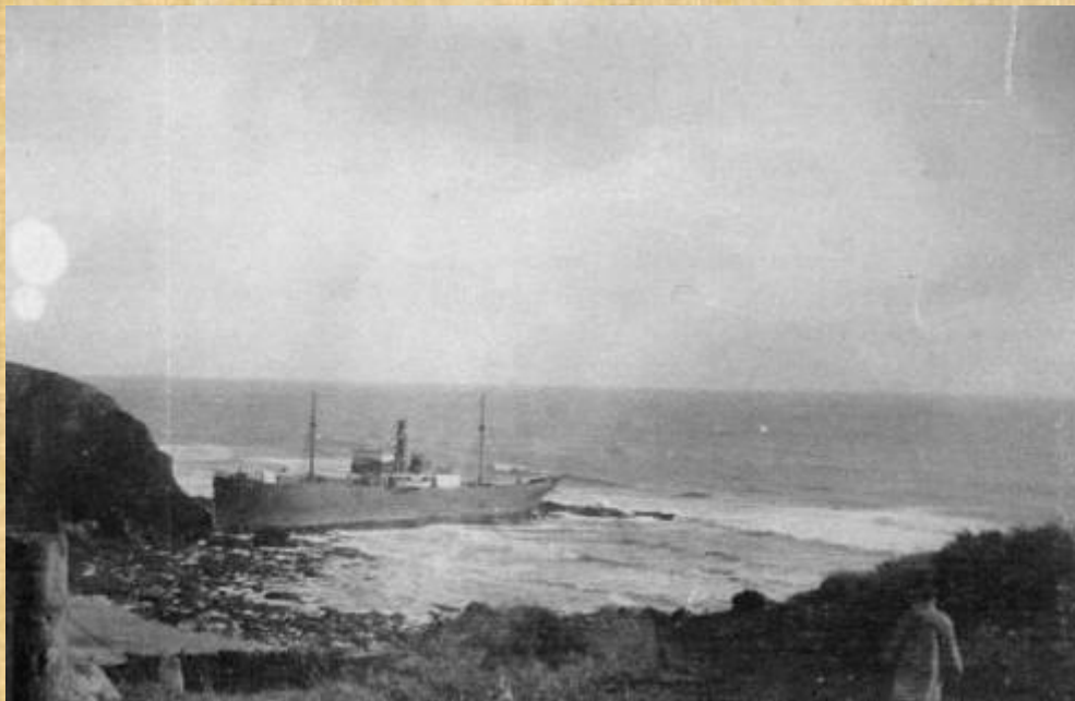
Vista general del lugar del accidente con el Cirilo Amorós embarrancado.