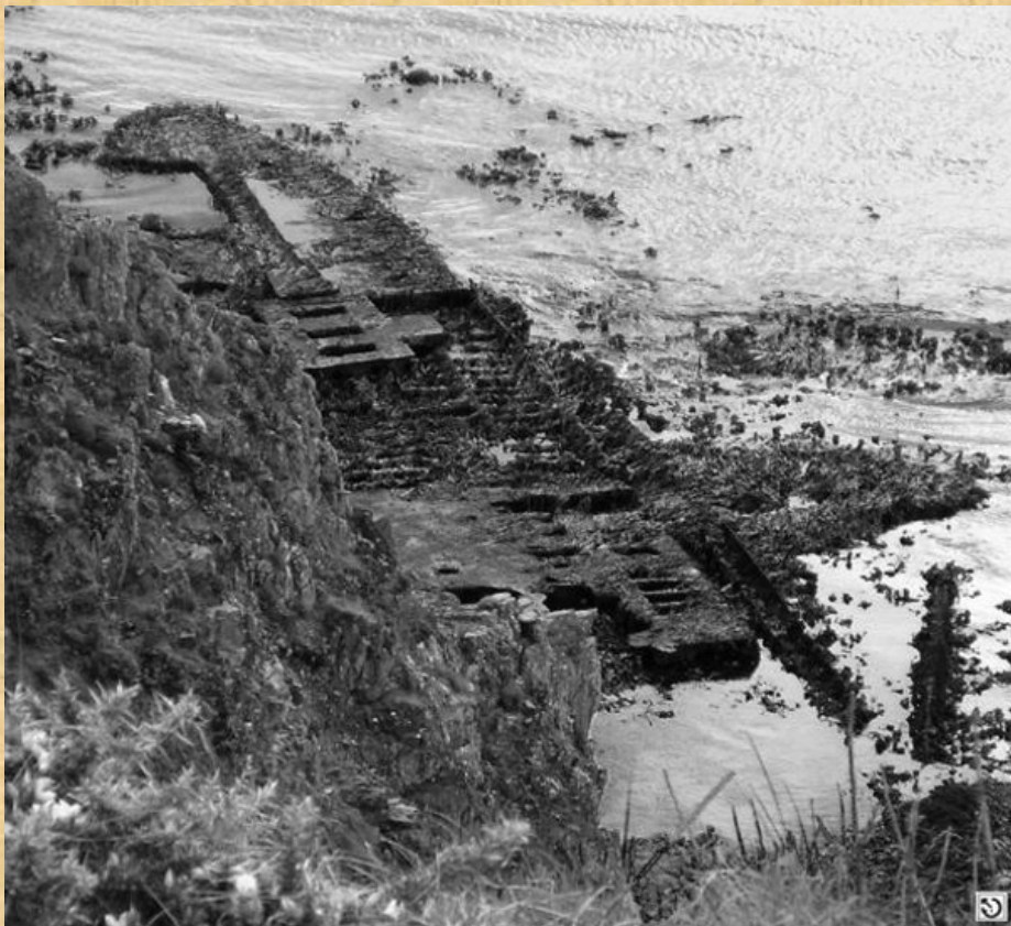
Los restos, en forma de zapatilla, después del desguace.