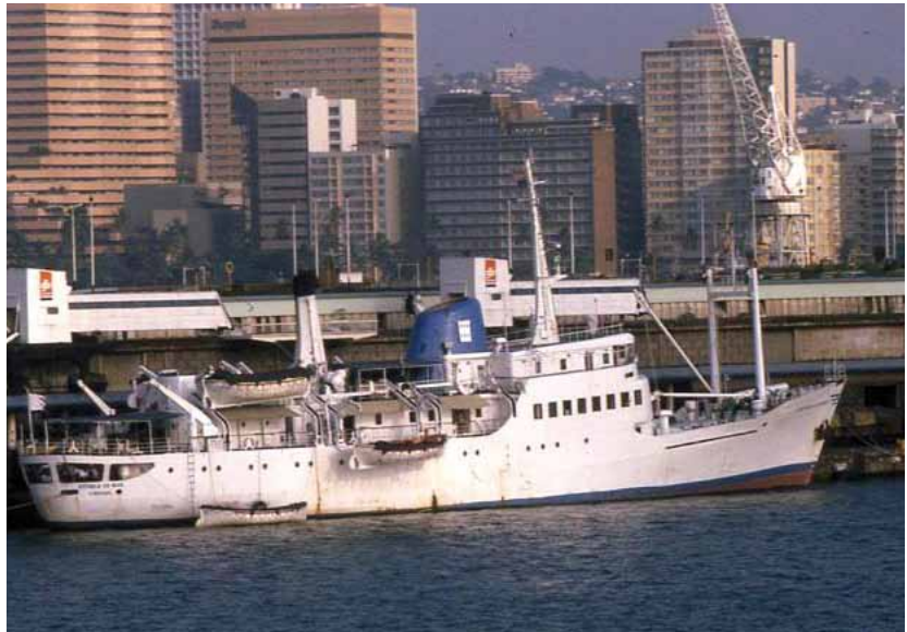
FOTO 9 ATRACADO EN DURBAN (SUDÁFRICA), YA CON UN NUEVO NOMBRE.