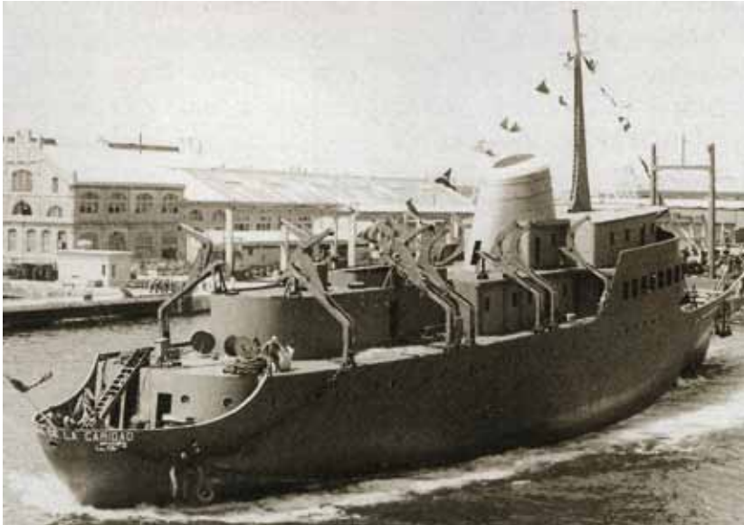
FOTO 4. A FLOTE, TRAS SU BOTADURA.