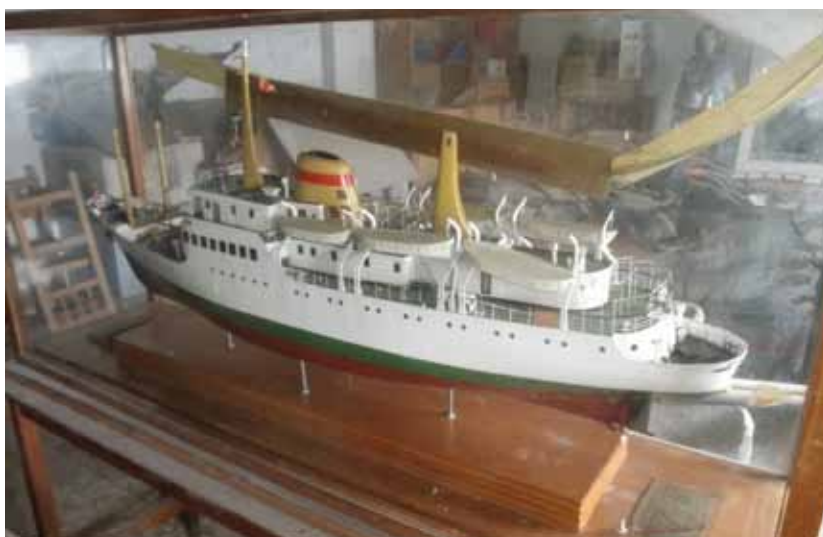
FOTO 2. LA MN SANTA MARÍA DE LA CARIDAD, VISTA DE POPA.

Siendo Sanlúcar de Barrameda, protagonista de primera fila del esfuerzo americano que dio lugar al descubrimiento del entonces denominado Nuevo Mundo, no por ello en el desarrollo de la toponimia de tan extensas nuevas tierras, apenas encontramos citas que nos recuerden que desde las playas y puertos de esta ciudad, con el trabajo y entrega de sus