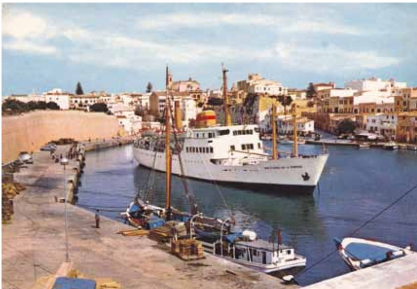
FOTO 5. PRIMEROS SERVICIO TRAS SU ENTREGA. MANIOBRANDO PARA ATRACAR -PROA PARA FUERA-, EN EL PUERTO DE CIUDADELA (MENORCA).