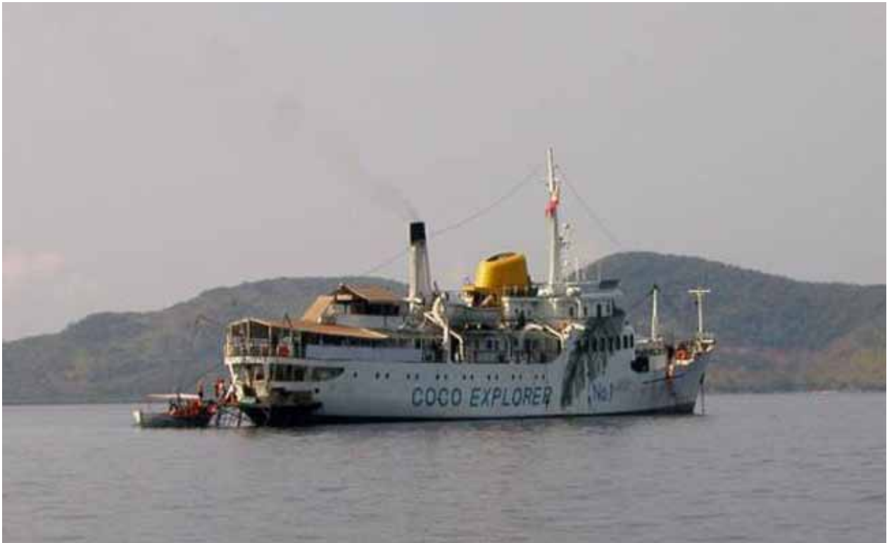
FOTO 11. VISTA DE POPA, CON LA MODIFICACIÓN PARA OPERAR CON LAS ZODIACS DE BUCEADORES EN AGUAS FILIPINAS.

Shuangshui Shipbreaking Co., precisando para ello, realizar su último viaje desde Batangas a Xinhui (China), a donde arribó en septiembre de 1995 para ser desguazado, finalizando así su vida activa que se prolongó más de 29 años a flote.