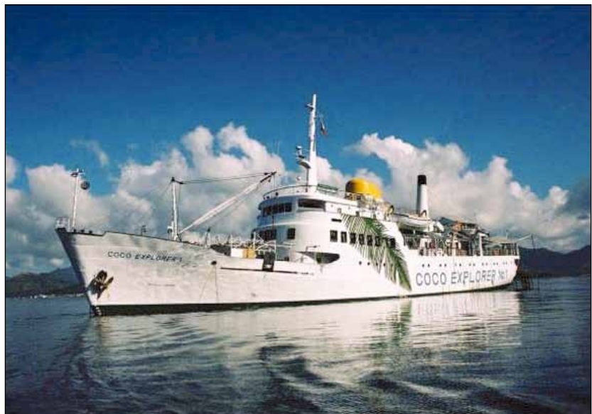
FOTO 10. LA M/N COCO EXPLORER Nº 1 (ANTIGUA SANTA MARÍA DE LA CARIDAD) EN AGUAS FILIPINAS, TRANSFORMADA EN FERRY TURÍSTICO PARA BUCEADORES.

cen averías, especialmente en sus motores, lo que dio lugar a que su armador tuvo que suspender sus cruceros, ofreciendo el último viaje como buque turístico, la última semana de julio de 1995, por ello nuestro originalmente emblema sanluqueño por los mares, durante la segunda parte del siglo XX, fue amarrado en Batangas (Filipinas) para su desarme y puesto a la venta por 200.000 dólares, adquirido a finales de agosto por la compañía de desguaces china Guangdong Xinhui