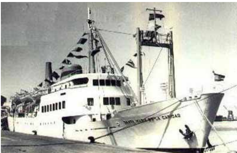
FOTO 6. ATRACADO EN EL PUERTO DE CÁDIZ EL 27. 03.1967, ENGANLANADO PARA RECIBIR A LA REPRESENTACIÓN DE SANLÚCAR DE BARRAMEDA. DIARIO DE CÁDIZ 28.03.1967.