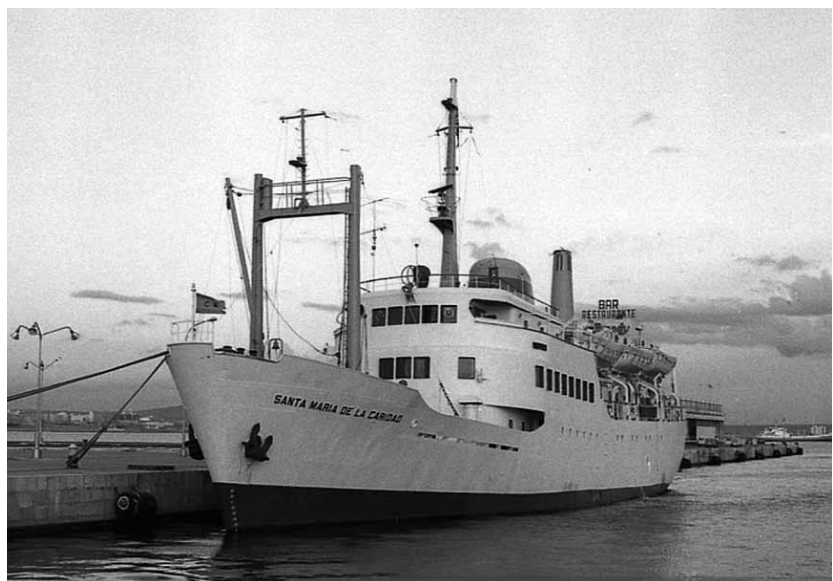
FOTO 8. ATRACADO EN EL MUELLE ESPAÑA DEL PUERTO DE CEUTA, FOTO: TEODORO DIEDRICH.

Volviendo al buque protagonista de este artículo, una vez incorporado en Canarias, cubrió las líneas entre los puertos mayores y los puertos menores del archipiélago con regularidad, siendo en ocasiones trasladado al sector de Baleares para reforzar los tráficos insulares en los periodos puntas de esta turística zona, e incluso efectuó las travesías de la popularmente llamada línea del piojo, que enlazaba Ceuta (foto 8), con Melilla y los fondeaderos de los Peñones de Vélez de