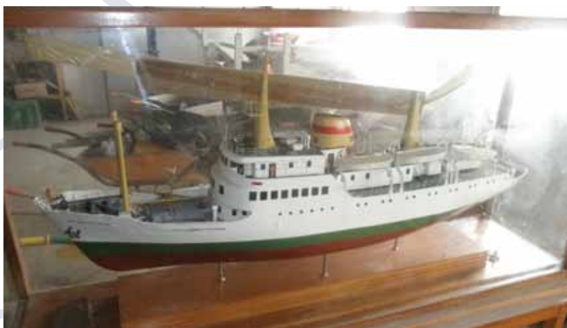
FOTO 1. MAQUETA DE LA MN SANTA MARÍA DE LA CARIDAD, EN EL DEPÓSITO MUNICIPAL.