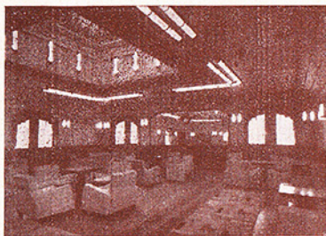
Salón fumador 1.ª clase