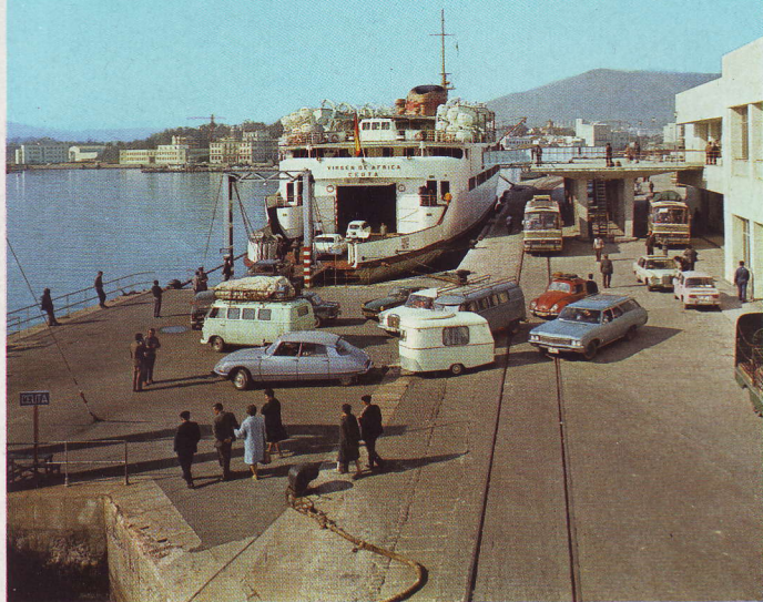
EMBARQUE DE VEHICULOS